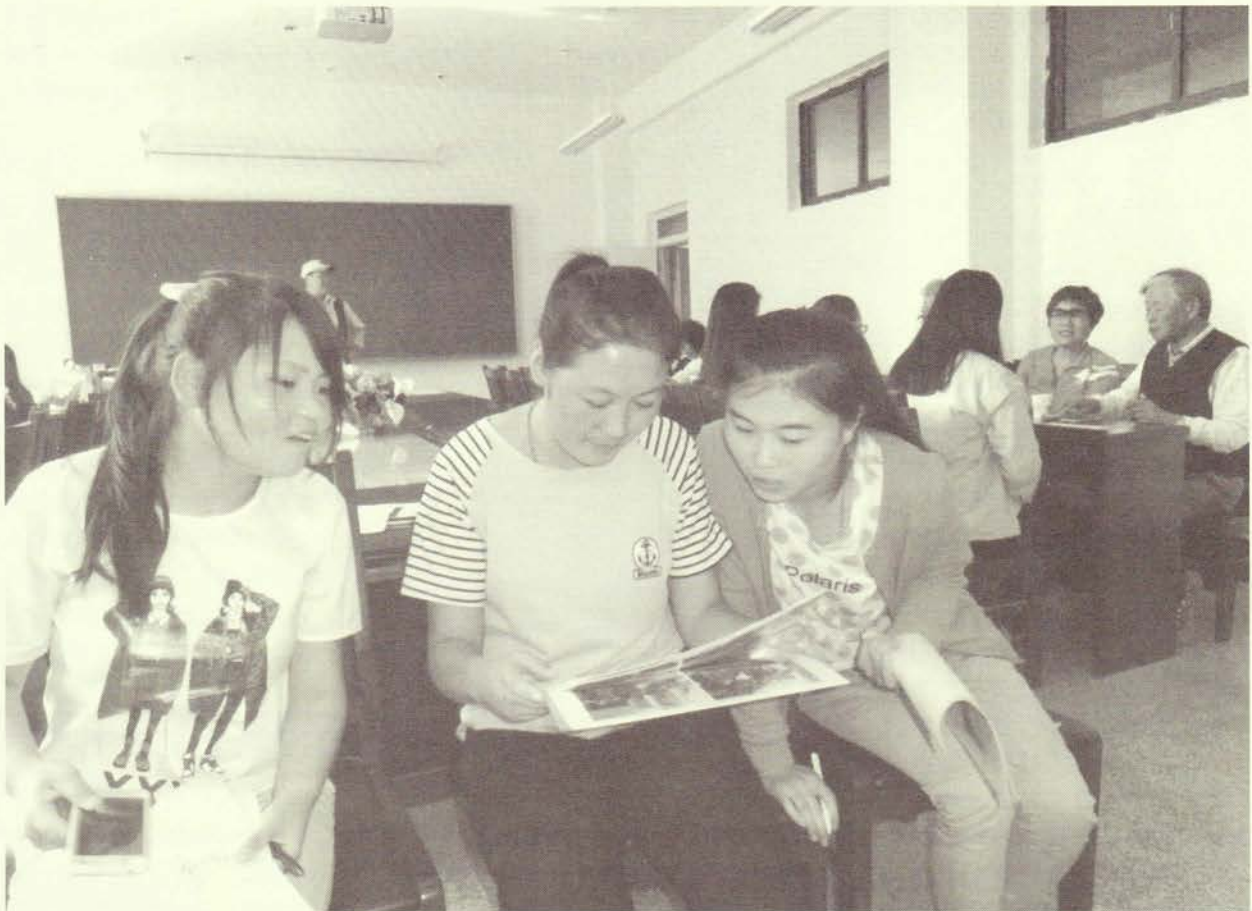
植林の説明資料に見入る学生（蘭州理工大学にて）

発行／特定非営利活動法人 黄河の森緑化ネットワーク 常務理事・事務局長／矢野正行 編集責任者／小川良太 〒650-0011 神戸市中央区下山手通り2丁目12-11 神戸華僑会館内 TEL・FAX:078-392-8328 E-mail:kouganomori@s6.dion.ne.jp URL:http://www.k3.dion.ne.jp/~kougakfg IP:05031111874