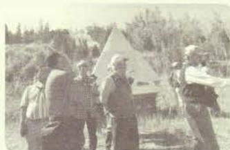
日中友好碑の前で思い出話